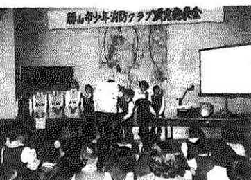
勝山市少年消防クラブ研究会発表会

B・F・Cが研究発表 勝山市少年消防クラブ研究会発表会が、この程教育福祉会館で開かれ、市内小中学校の十三クラブが参加、日頃の研究成果を発表、県大会出場権は成器南小と中部中が獲得しました。それぞれのクラブの代表者は研究テーマに対する成果を図表やOHP、スライドなどを使い