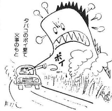
タバコのポイ棄て 火事のもと

が過半数を占めています。これからは、山の手入れや植林の準備、山菜採りなどで山へ多くの人びとが出かけます。ちょっとした不注意が山火事をひきおこします。次のことをしっかりと守ってください。