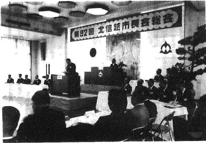
第92回北信越市長会総会 (勝山市教育福祉会館で)