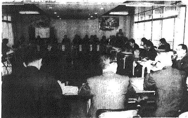
市民会館で開かれた雪害対策会議