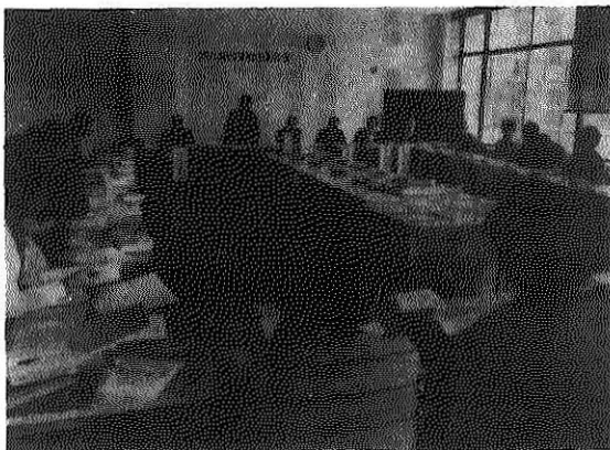
熱心に懇談する消費者と業者

市と市消費者団体連絡協議会はこの程、市役所三階会議室で「米に関する消費生活懇談会」を開きました。同会の会員をはじめ市内の米屋さん、果経経済連、福井食糧事務所、果経経済連、勝山商工会議所などの関係機関代表者約三十人が出席、米の流通過程や品質区分、消費状況などについて説明と意見交換が行われました。