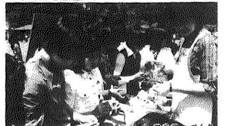
ペーパー・フラワーづくり