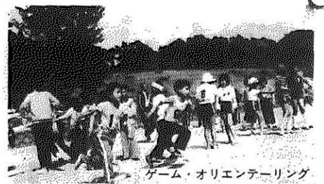
ゲーム・オリエンテーリング