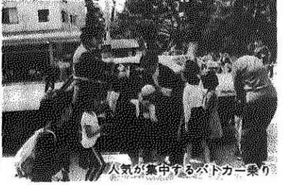
人気を集めるバトカー乗り