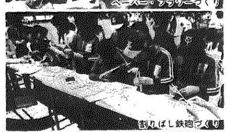
割りばし鉄砲づくり