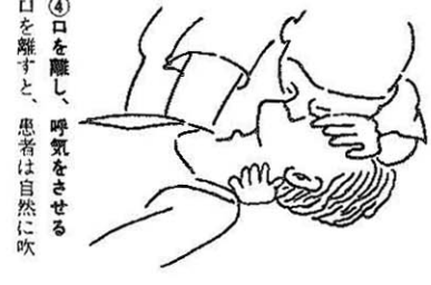
④ 口を離し、呼吸をさせる 口を離すと、患者は自然に呼吸を再開します。