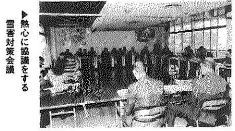
▶熱心に協議をする 雪害対策会議

道路沿いの建物、樹木、へいなど損傷を受けるおそれのあるものについては、補強するとともに赤旗などを立てておいてください。 危険ですから、除雪車には近寄らないでください。通り抜けるときは、運転手の指示に従ってください。 除雪車が通過するときには、道路沿いの河川などで洗いものをしているとき、雪に押し流される危険がありますから、その場所から離れてください。