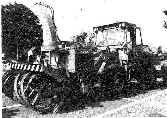
▲除雪力強化のために新しく買入れたベイローダ

今年も雪の季節が訪れてきました。福井地方気象台は十一月二十日、十二月から来年二月までの向三ヶ月間の長期気象予報を発表しました。これによると、「一月を中心に寒い日が多く、一時大雪の降るおそれもある」とのことです。 わたしたち雪国に住むものの宿命ともいえますが、雪に対する備えは十分しておかなければなりません。 市は、このほど、勝山土木事務所、勝山警察署、市消防署、各地区区長会長など関係機関や関係者とともにも雪害対策会議を開き、除雪計画など雪害対策をまとめました。