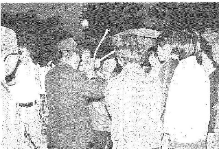
▲消火器の取り扱い方を学習する

昭和五十六年——今年が「国際障害者年」です。 昭和五十一年の国連総会で決定された世界的規模の行動で、テーマは、障害をもつ人の社会への「完全参加と平等」です。障害をもつ人に対する理解と関心を深め、みんなが参加し、みんなが平等に暮らせるよりよい社会づくりをしようという年——「国際障害者年」に当たって、みんなで考えよう。