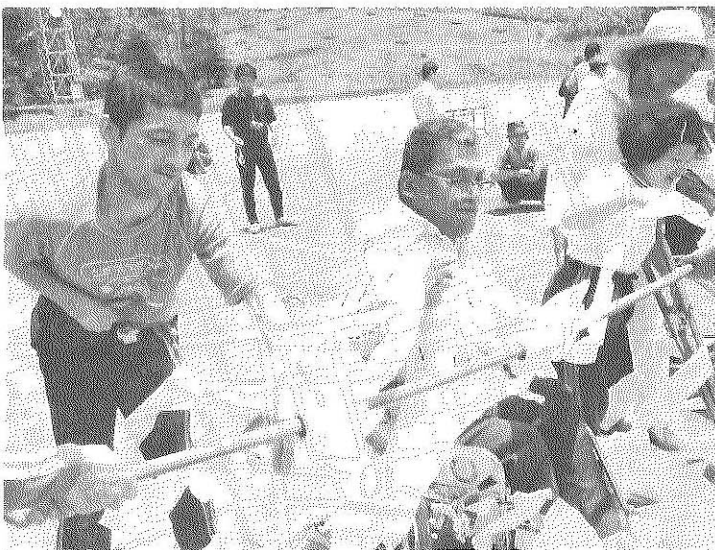
▲紙とり競争を楽しむ

つのと、福井県厚生部長代理、武内市議会副議長らの来賓祝辞があつて、いよいよ競技開始となりました。競技種目は、身体の不自由でも参加できるように、いろいろくふうされており、アメツマミ競争、紙とり競争、やり正確投げ競争など愉快なゲームばかりです。障害者のみなさんは、身