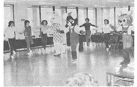
ピッピーたいそうを習う保育所の保育さんたち

市では、交通安全運動の一環として、幼児のための交通安全体操「ピッピーたいそう」の普及をはかっています。 これは、全国交通安全母の会が推しているもので、市もこれをとりあげようと、勝山警察署、勝山交通安全協会に協力を求め、ぬいぐるみの製作やレコードの配布などをお願いしました。 また、「ピッピーたいそう」の振り付けのなかで、幼児にとってむずかしいと思われるところは、市内幼稚園の先生の協力 を得て、幼児向けに直してもらいました。 ぬいぐるみは、くまの「ごろちゃん」といって、「ピッピーたいそう」のときにあいさつをふりまします。 このほど、成器西幼稚園で開かれた第一回交通安全教室で、このくまの「ごろちゃん」が登場して、「ピッピーたいそう」を行ったところたいへん好評でした。 みなさんもぜひ覚えてください。