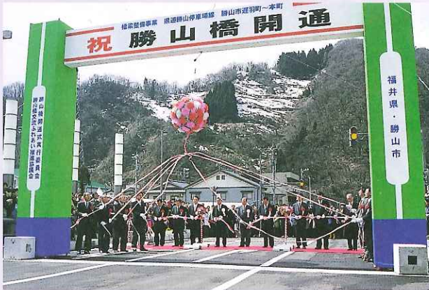
市の玄関口の新しいシンボルとして新勝山橋完成（3月）

20世紀最後の年、西暦2000年。長尾山総合公園に県立恐竜博物館が完成し、「恐竜エキスポふくい2000」が開催されました。勝山市にとって記念すべき年になり、エキスポに参加した多くの市民に感動と貴重な体験を残してくれました。また3月には念願の新勝山橋が完成、4月からは介護保険が導入。11月に行われた市長選挙では新市長が選ばれ、大きな節目の年となりました。