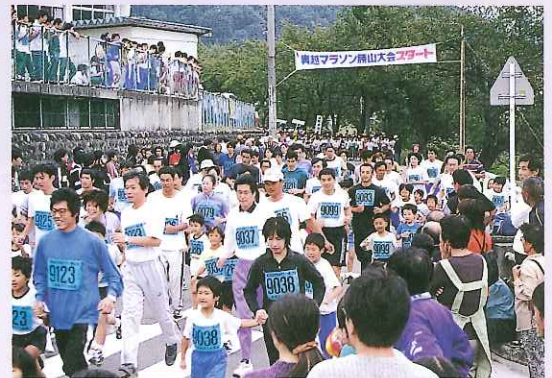
1,300人が健脚を競った 第20回奥越マラソン勝山大会 (10月)