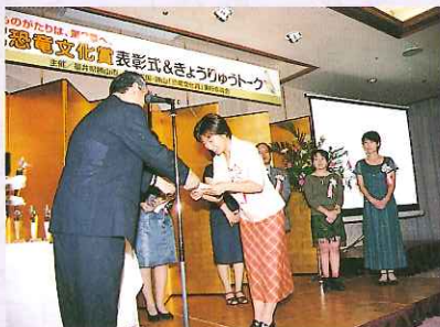
5,700作品を集めた 第2回恐竜文化賞表彰式 (8月)