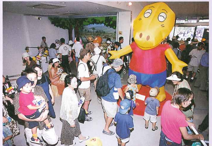
80万人を超える人たちにぎわった恐竜エキスポ（7月～9月）