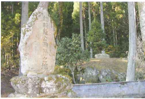
畑ヶ塚に建てられた石碑

南北朝動乱の時期、南朝方の武将時能は屈強の十六騎を率いて鷲ヶ岳に兵を挙げた。新田義貞の戦死後、その弟脇屋義助とともに黒丸城に斯波高経を攻め一時は加賀に追ったが、後に湊城で高経に大敗。翌々興国二年(一三三二)時能は、坂井郡鷹栖城にこもり、さらに十月伊知地に兵を挙げたものである。この伊知地での合戦の様