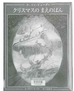
クリスマスのまえのぼん 詩・クレメント・ムア 絵・ターシャ・テューダー

野口悠紀雄 著 沢木耕太郎 著 宮本 輝 著 阿川 弘之 著 ジョン・グリシャム 著