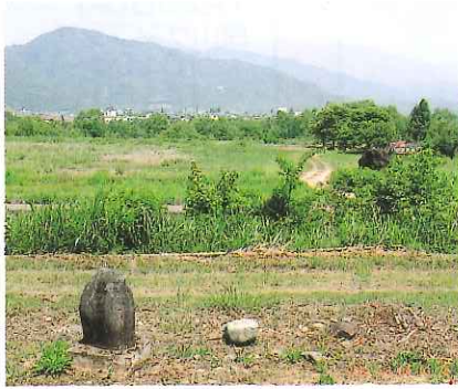
遅羽町の中島からみた「鵜島の渡」