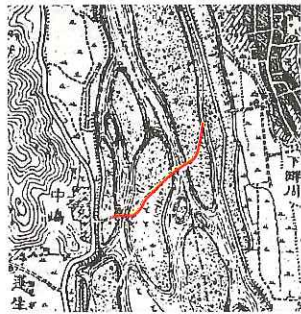
1902年(明治35年)の地形図

「鵜島の渡」は「中島の渡」ともい、遅羽町中島と勝山市街を結ぶ九頭竜川の渡しであった。明治後期になると、「鵜島の渡」は当時の遅羽村がたずさわられるようになり、各集落が船頭の報酬費はもちろん、渡し船や船頭小屋の建造費も負担したようである。このため、遅羽の住民の渡船料は無料であったが、村民以外の人からは一回一銭を徴収した。船頭の報酬として、各戸が一年間に白米三升五合と麦三升を負担した。毎日二百