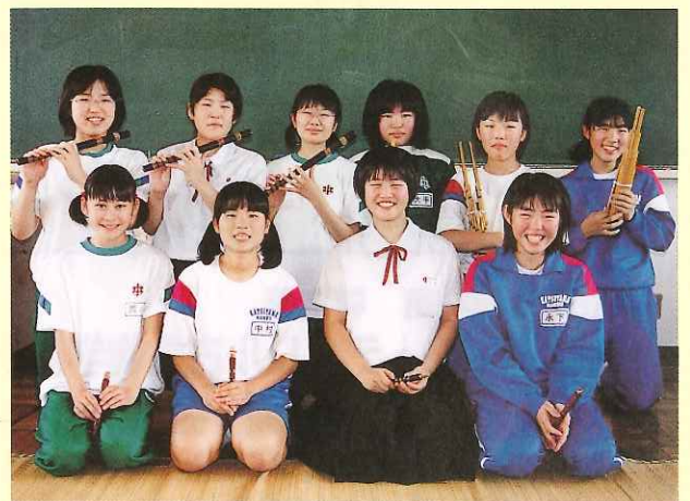
「雅楽」に親しむ 勝山南部中 雅楽学習クラス

勝山南部中学校では、総合学習の時間に「雅楽」を取り入れています。雅楽を学習している生徒は2、3