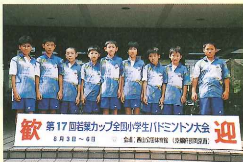
第17回若葉カップ全国小学生バドミントン大会 8月3日～6日 会場: 西山公園体育館(京都府長岡京市)