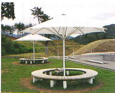
長尾山総合公園に休憩施設(固定式パラソル2基、固定式ベンチ6基)

宝くじの普及広報事業により、(財)自治総合センターの助成をうけて2組の設備を整備しました。