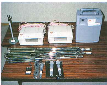
消防本部にイベント用放送設備と広報活動用デジタルビデオカメラ等一式