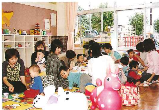
子育て支援センターの様子