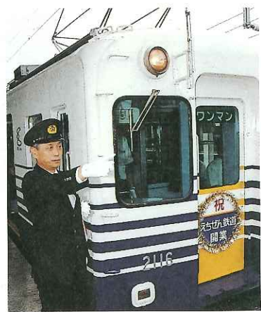
声、高らかに「出発進行！」