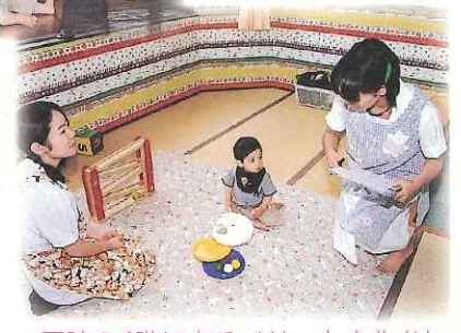
医院の4階にあるメリットを生かし、看護師の回診があります