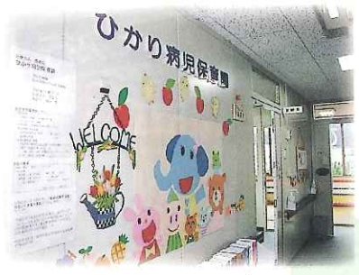
エレベーターをおりると動物たちがお出迎え