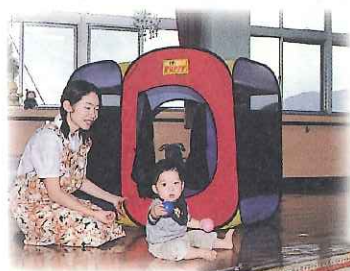
熱がさがれば元気いっぱいホールで遊びます