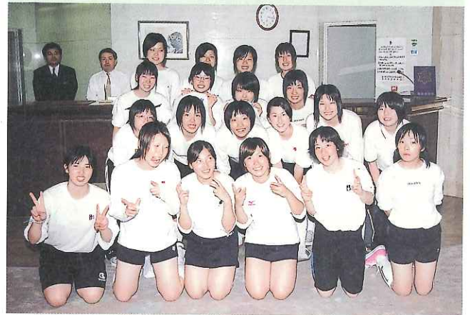
練習帰りの学生たち（勝山ニューホテルロビーにて）

夏休み中に大阪、神戸などの7校から230人を超える学生たちがふれあい交流館を拠点に市営体育館など、市内の体育施設を利用しています。体育館等で見かけたら気軽に声をかけてあげてください。