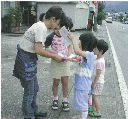
ウォークラリーをする子どもたち

当日は親子約30人が参加。子どもたちは各ポイントにあるヒントを頼りに、同町内に10軒ある「かけこみ10番」の家を探し当て、訪れたことを証明するシールを集めていきました。