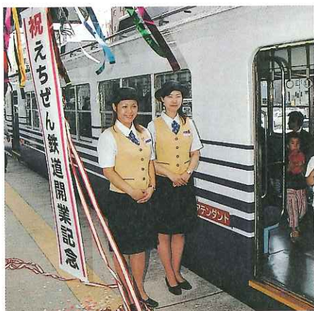
アテンダントの笑顔が乗客をお出迎え

なお、えちぜん鉄道は、三国芦原線が8月10日に全線開通済、勝山永平寺線は10月5日に全線開通の予定です。