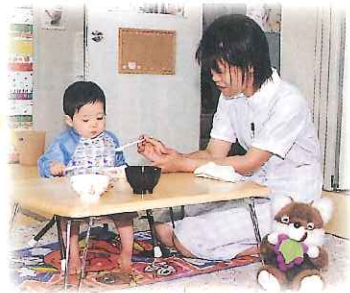
症状に合わせた食事やおやつを用意します