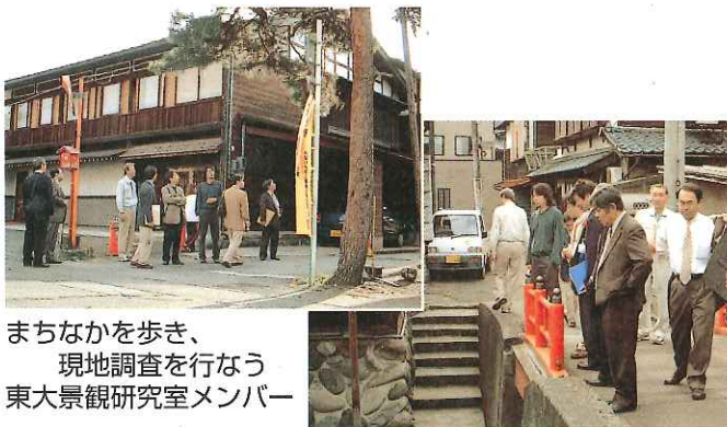
まちなかを歩き、 現地調査を行なう 東大景観研究室メンバー

本年度は地域の抱える課題を洗い出し、住民のみなさんの合意形成を図るため、4月から積極的に各地区や商店街に対する説明会を実施しています。