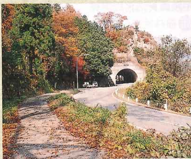
県道沿いに今も残る「淡月道」