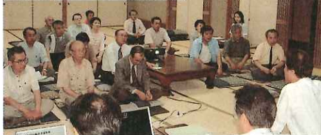
説明会やワークショップに参加する市民のみなさん

本年度は地域の抱える課題を洗い出し、住民のみなさんの合意形成を図るため、4月から積極的に各地区や商店街に対する説明会を実施しています。