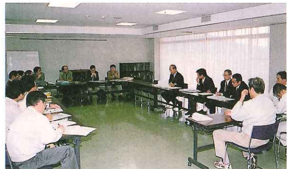
東大景観研究室メンバーと まちづくりについて討議する市職員