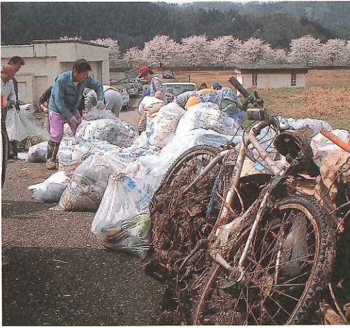
区民らが回収した、たくさんのごみ

この日は、地区の大人から子供まで約100名が参加。参加者らはアシに引つかかったビニールや空き缶などを手作業で拾い上げ、半日で約300キロのごみを集めました。中には自転車や家電などのごみもありました。参加者の一人は「私たち、この川の流域に住む人たちが協力しなければ、ごみは減らないと思う」と理解と協力を訴えていました。