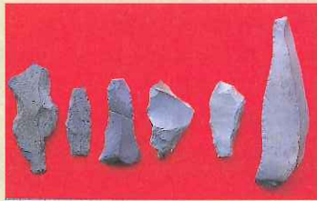
⑥ ⑤ ④ ③ ② ①

南幅遺跡出土の旧石器からは、九頭竜川の河岸段丘上を食料を求めて移動していた勝山最古のハンターの姿が見えてくる。 (教育部文化課)