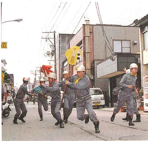
迫力あるまといリレーで市街地を力走!

コース終盤の長山公園では土手の上で待ちかまえる次走者へまといを放り上げる恒例の「見せ場」もあり、沿道で応援する市内の幼稚園・保育園児や一般の見物客から、大きな歓声や拍手が送られていました。