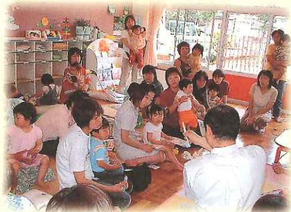
ニポールたいいむ (育児講座)

子育てや健康など、専門の先生のお話を聞いたり、お母さん・おばあちゃんたちが体験をもとに話し合い、情報を交換して子育ての輪を広げましょう！