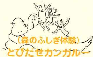
(森のふしぎ体験) とびだせカンガルー

なお、小学校1年生のいる世帯については、特に手続きの必要はありません。法案成立後、支給させていただきますので、よろしくお願ひします。 ※現況届は、すべての対象者が必要となります。本紙18ページをご覧ください。