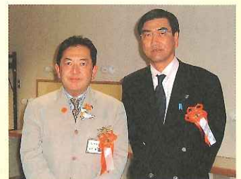
田中知事と環境について意見交換