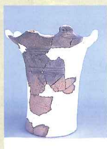
杉原遺跡から見つかった土器(復元)