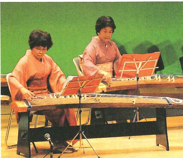
日頃の練習の成果をステージ上で披露する芸能発表会

市民総合文化祭は、1月10日までの期間中、市内各所を会場に、展示会や演奏会などが開かれる予定です。