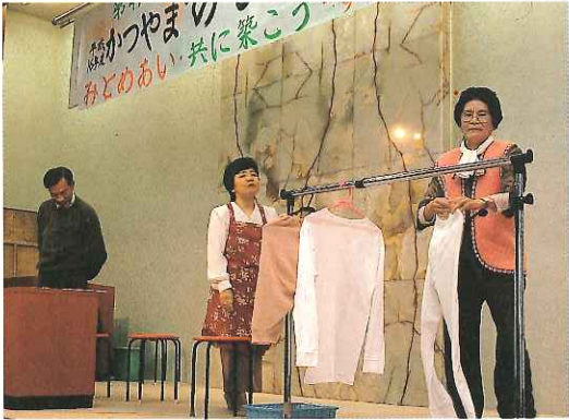
男女共同参画を題材にした寸劇

講演のあと、市男女共同ネットワークと市男女共同参画推進会議のメンバーらによる寸劇が披露され、家庭における男女間の今昔を内容にした演技に、会場からは笑いや拍手がおこると共に、見ている人の関心をさそっていました。