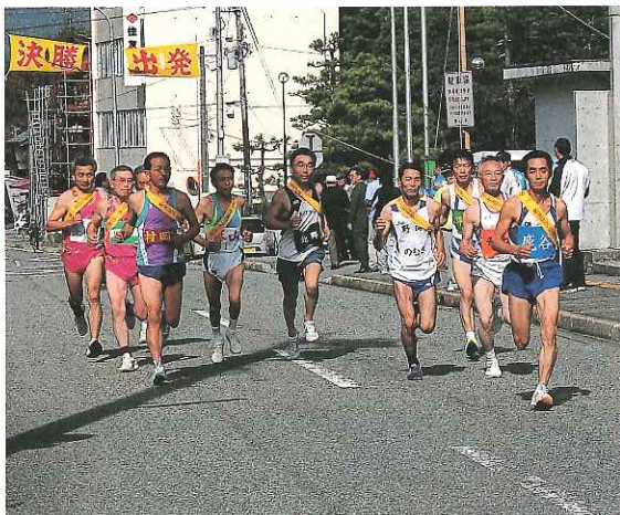
記念すべき50年目のスタート!

競走は、市内9地区から参加した9チームの対抗で行われ、今年も市内愛好会のチャムゴン楽走会がオープン参加しました。結果は、勝山地区が3年ぶりに優勝を果たしました。