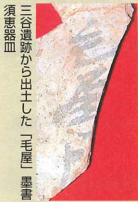
三谷遺跡から出土した「毛屋」墨書須恵器皿