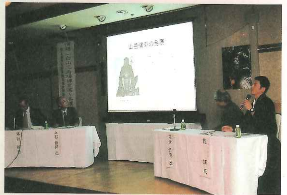
それぞれの視点で禅定道の魅力を語るパネリスト

中世修験道の魅力に迫る 「市民フォーラム」 テーマは「白山禅定道」 24日は、白山文化により親しむことを目的とした「市民フォーラム」が、市ふれあい交流館（勝山ニュー