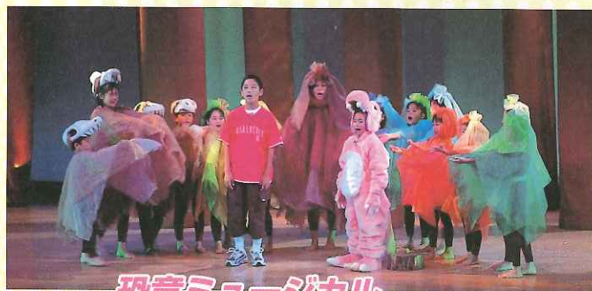
恐竜ミュージカル