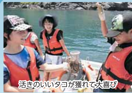
活きのいいタコが獲れて大喜び