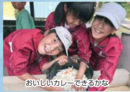
おいしいカレーできるかな