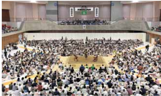
力士や観客の熱気に包まれた会場

風格漂う三横綱 三横綱が土俵入りすると、会場は大いに盛り上がり、多くの歓声が送られました。