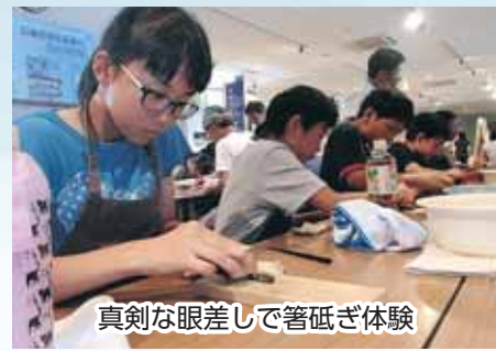
真剣な眼差しで箸砥ぎ体験