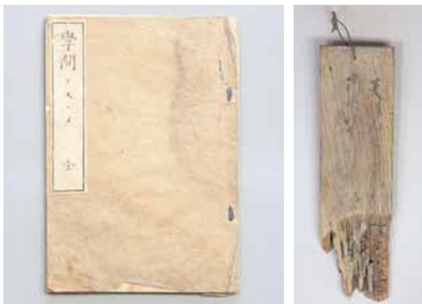
学問ノススメ(左)と御廻国様木札(右)

展示では、旧木下家住宅の概要や修理工事の内容を工程順にパネルで紹介しています。また、修理工事の中でわかってきたことや、永平寺大工が関わったと思われる精巧な加工技術なども紹介しています。歴史コーナーでは、江戸時代から、明治・大正・昭和の木下家の歴史や、各時代ごとのような仕事に携わってきたのかについて古文書や史資料で紹介しています。主な見どころは、幕府巡見