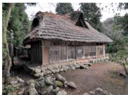
国指定時の旧木下家(平成22年)

建物内部の間取りについても、当初の形を良く残しています。玄関を入ると、前面に大きな土間空間が広がり、その後方に8畳の和室が4部屋配置されています。さらに、その奥に仏壇を置く部屋や坊主部屋が配置されます。これは、冠婚葬祭時に、仏壇を中心に建物内部を広く使う工夫がなされた間取りで、浄土真宗の信仰の厚い地域特有のものと言えます。