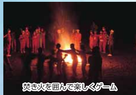
焚き火を囲んで楽しくゲーム