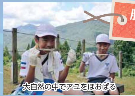
大自然の中でアユをほおぼる