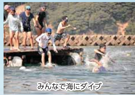
みんなで海にダイブ