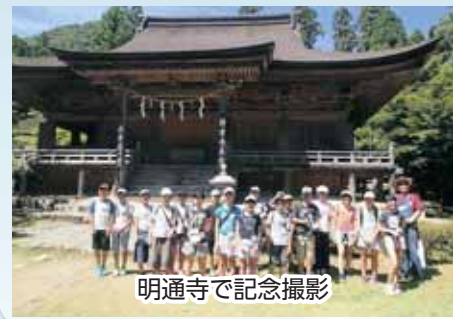
明通寺で記念撮影

7月21・22日に小浜市の矢代地区で行われ、勝山市8人、小浜市9人の小学6年生が参加交流しました。1泊2日で、タコかご漁やタコ焼き作り、タコの串焼き、シーカヤック、海水浴、箸砥ぎなど小浜の魅力体験しながら交流を深めました。タコかご漁では、力を合わせて仕掛けてあったタコかごを引き揚げ、初めて触るタコの感触に戸惑いながらも、みんなで獲れたことを喜んでいました。 冬は勝山市でスキー体験など勝山の魅力を体験しながら交流を深める予定です。