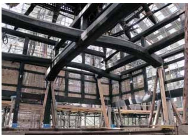
修理途中の建物内部