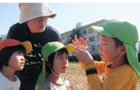
アキアカネの産卵の観察

東海北陸6県の保育関係者が一同に集まり、第59回東海北陸保育研究大会が福井市で開催されました。この大会で、勝山市の認定こども園、公立保育園全11園で作る勝山市公私立保育研究会が、「自然と関わる中で育つ心く保育者、子ども、保護者の関係」をテーマに5年に渡り取り組んできた研究について発表を行いました。