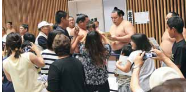
相撲ファンにサインする横綱鶴竜