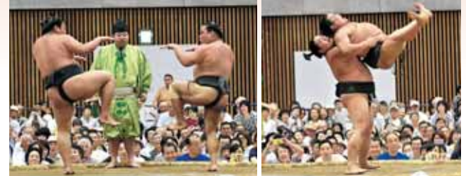
息の合った掛け合いで禁じ手などを披露