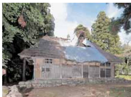
修理前の旧木下家(平成27年)

このような間取りは、福井市から勝山市・大野市にかけて分布するもので、その代表例が木下家と評価されています。さらに、建築年代がよくわからない古民家が多い中であって、木下家には建築関係の資料が残り、腕の良い永平寺大工が携わったことがわかる記録が残されています。 このような理由から、平成22年に国の重要文化財に指定され、県内では、7番目の茅葺き民家の指定となりました。今回の修理工事は、建築以来、180年ぶりの大規模修理となるとともに、県内の重文茅葺き民家の本格的修繕としては、昭和53年に行われた越前市の旧谷口家住宅以来、40年ぶりの工事となりました。