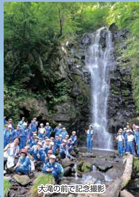
大滝の前で記念撮影