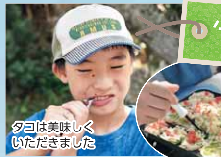
タコは美味しくいただきました