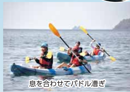
息を合わせてパドル漕ぎ