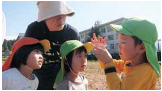
アキアカネの産卵の観察

東海北陸6県の保育関係者が一同に集まり、第59回東海北陸保育研究大会が福井市で開催されました。この大会で、勝山市の認定こども園、公立保育園全11園で作る勝山市公私立保育研究会が、「自然と関わる中で育つ心く保育者、子ども、保護者の関係」をテーマに5年に渡り取り組んできた研究について発表を行いました。