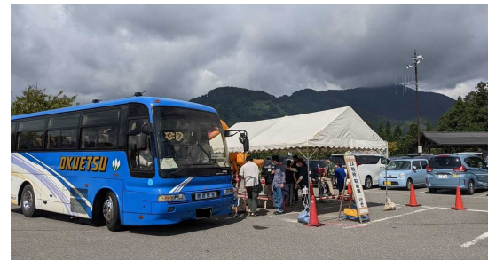
かつやま恐竜の森バス発着所