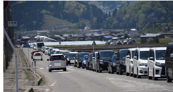
令和元年度に発生した渋滞の様子 (渋滞延長約4km)

かつやま恐竜の森(福井県立恐竜博物館)では、ゴールデンウィーク中、多くの来園者で混み合い、公園内の駐車場の満車や周辺道路の渋滞が予想されます。 渋滞緩和対策として、臨時駐車場の開設及びシャトルバスの運行を行いますので、ぜひご利用をお願いいたします。