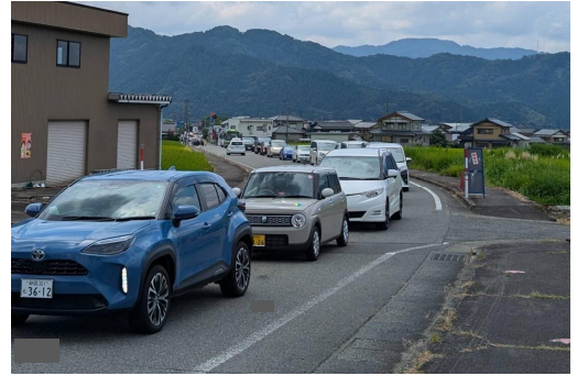
↑ 渋滞の様子(渋滞延長約3km)

勝山市は、渋滞緩和対策として、園内駐車場が満車となる時間帯に 公園の入場規制(10時~13時30分) 及び 公園周辺道路の交通規制(10時~15時) を行うとともに、臨時駐車場(JAM福井勝山マウンテンリゾート)からのシャトルバスの運行を行います。