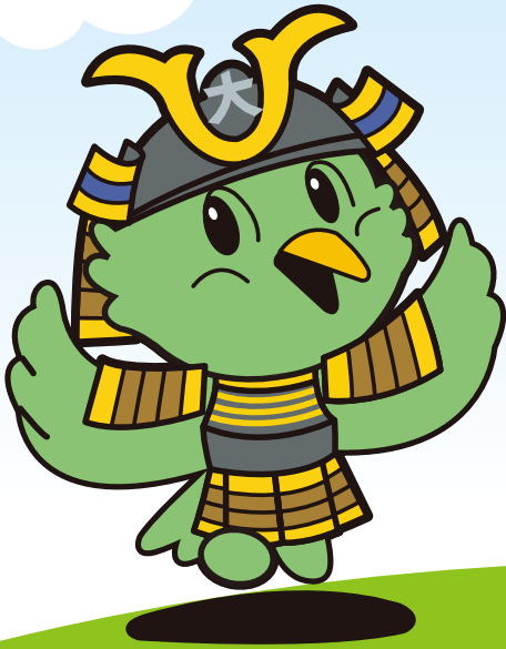
大野市マスコットキャラクター うぐピー