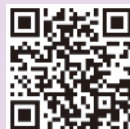
小型家電リサイクル協会ホームページ

小型家電リサイクル協会に登録の家電小売店に設置されています。 詳しくは右のQRコード、又は下のURLからご確認ください。 https://www.sweee.jp/ 対象となる製品は店舗ごとに異なりますので、店舗に直接確認してください。 ※破損・腐敗の状況によっては受け取りを断られる場合があります。