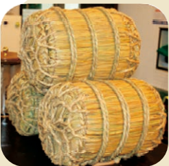
有機米コシヒカリの米俵