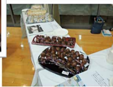
地域資源を活かしたまちづくりを 考えようの集い 「食」の紹介&試食