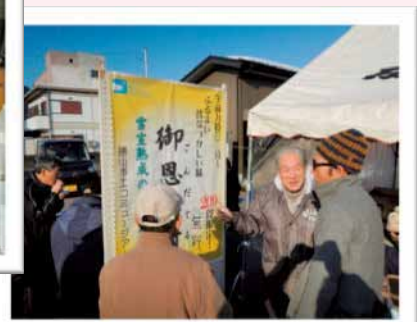
ふるまい汁/年の市