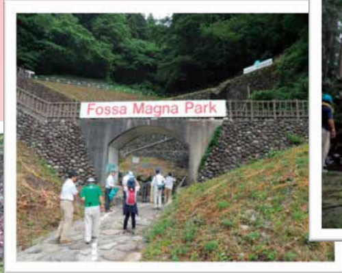
フォッサマグナパーク視察 /糸魚川ジオパーク