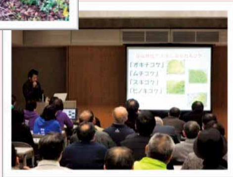
地域資源を活かしたまちづくりを 考えようの集い まちづくり事例発表/平泉寺地区