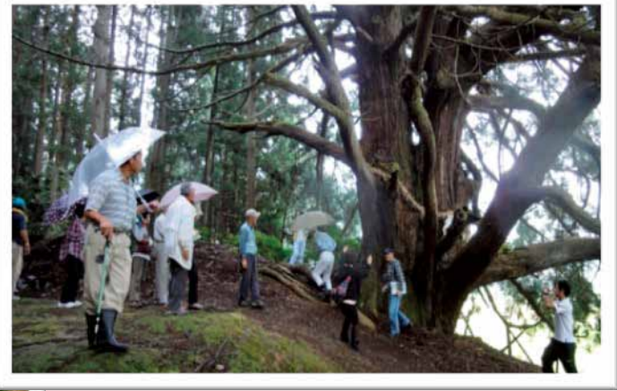
巨木めぐり/鹿谷町西光寺