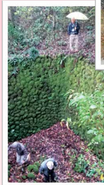
雪室研究調査 /遅羽町比島